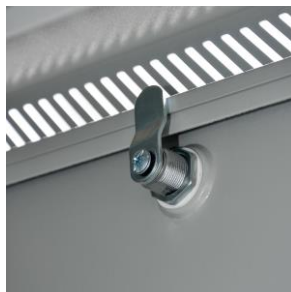
... zamki w drzwiach tylnych i bocznych