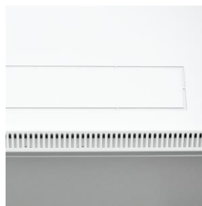
przepusty w podłodze i dachu