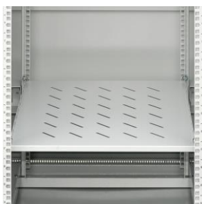
półki (nie dotyczy EM/SH05D-8816-SH0)