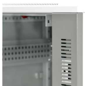
otwory wentylacyjne poprawiające chłodzenie urządzeń

Dołożyliśmy wszelkich starań, aby przedstawione informacje były rzetelne i kompletne. Jednak nie ponosimy odpowiedzialności za dokładność i kompletność danych oraz w szczególności nie możemy zagwarantować, że niniejsza specyfikacja nie zawiera błędów lub pomyłek. Informacje zawarte w niniejszej specyfikacji mogą zostać zmienione w każdej chwili bez powiadomienia.