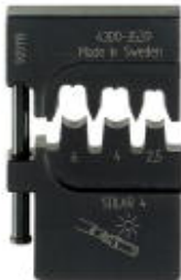
Matryca, do złązek solarnych MC4, wejście boczne, 2,5 - 6 mm 2

Należy pamiętać, że podane dane pochodzą z katalogu online. Proszę o pobranie kompletnych informacji i danych z dokumentacji użytkownika. Obowiązują ogólne warunki użytkowania dla materiałów pobieranych przez Internet. ( http://phoenixcontact.pl/download )